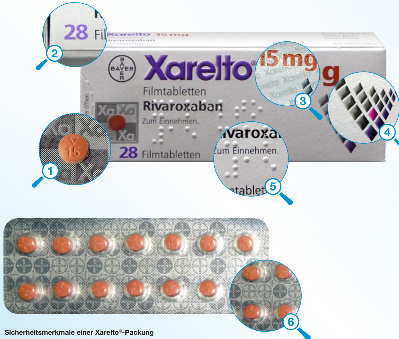
Sicherheitsmerkmale einer Xarelto®-Packung (weitere nationale Packungsvarianten sind möglich)

Die Aluminiumfolien der Filmtablettenblister sind vollflächig mit hellen und dunklen Bayerkreuzen geprägt.